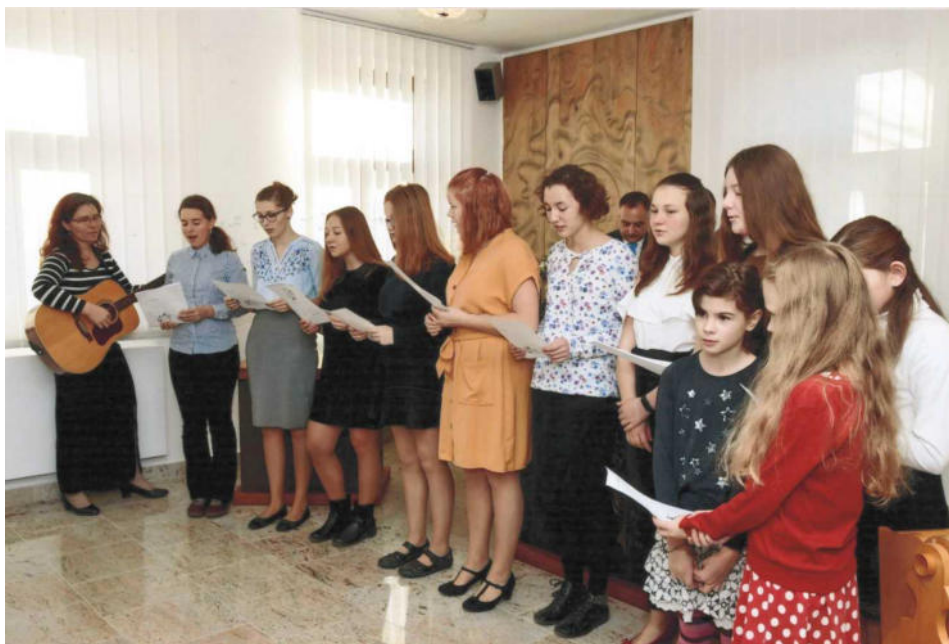
Vystupující na vítání občánků – skupina Gemini