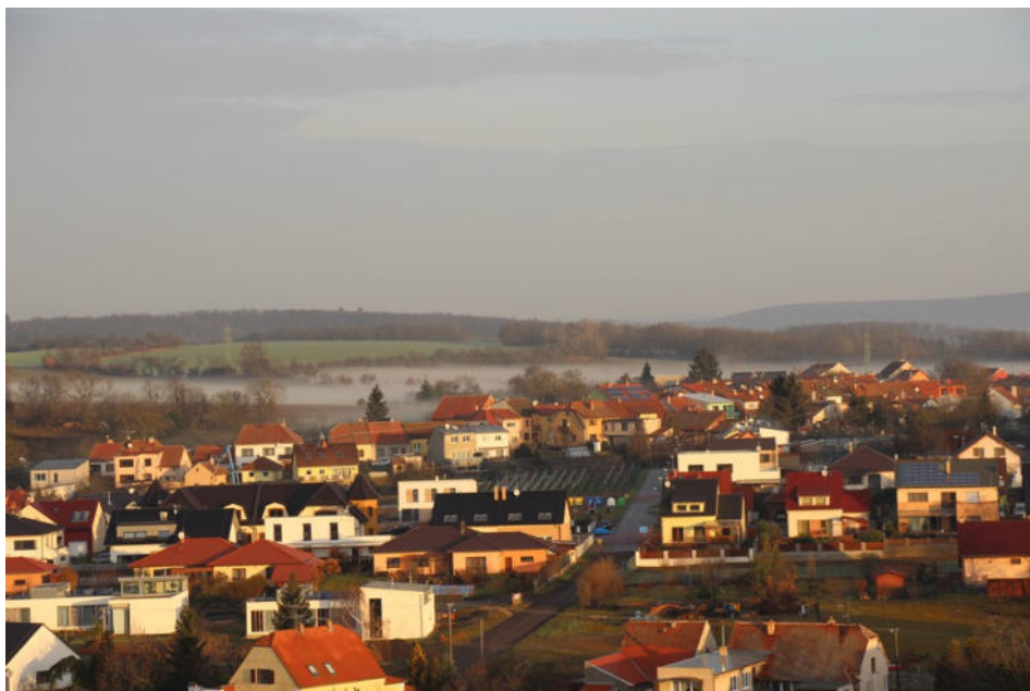
Netradiční pohled na Ořechov z věže kostela Všech svatých