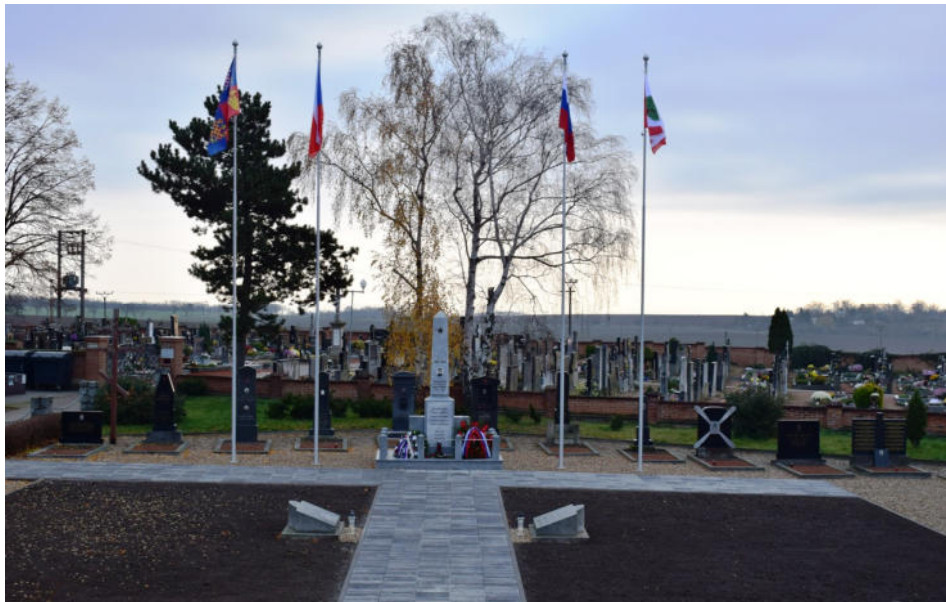
Nově upravené pohřebiště Rudé armády